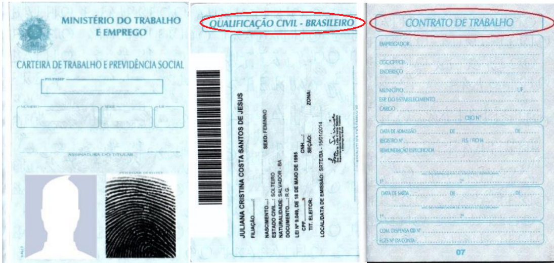
Figura 3: Página de identificação.