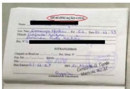
Figura 2: Página de qualificação civil.