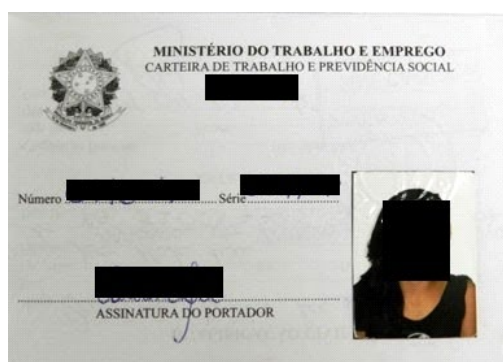
Figura 1: Página de identificação.