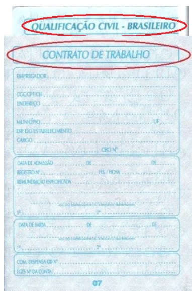
Figura 5: Página de qualificação civil.