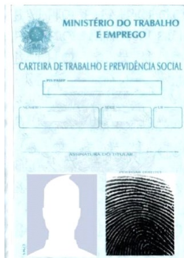
Figura 4: Página de identificação.