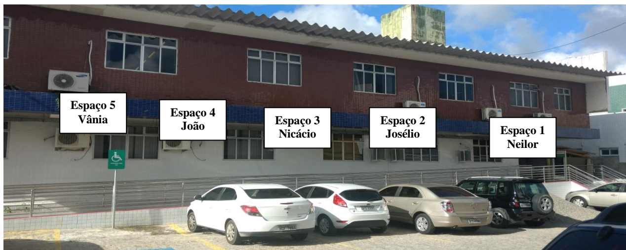
Foto 7: Muro das Salas de Informática (Entrada Lateral do Campus - Rua Carmelo Ruffo)