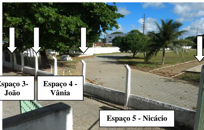
Fotos 2 e 3: Entrada Lateral do Campus (Rua General Maciel): entre portões de acessos.