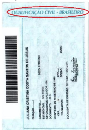
Figura 4: Página de identificação.