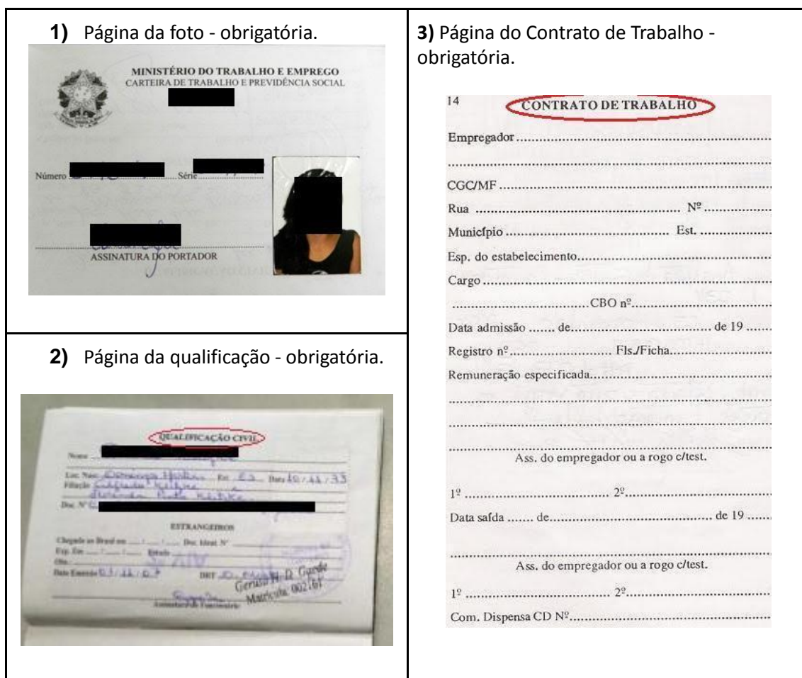
Figura 1: Página de identificação.